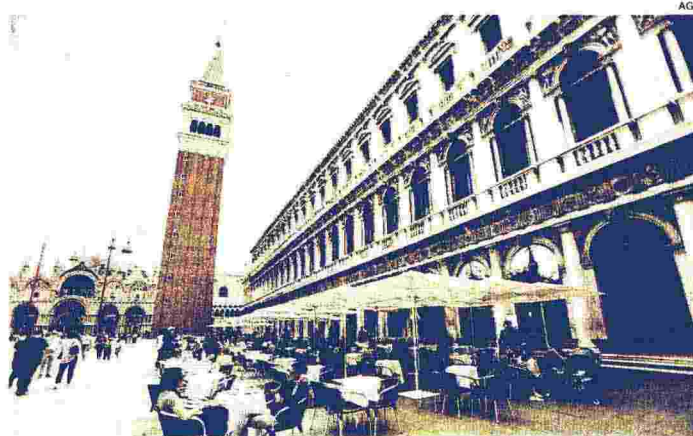
Città simbolo. Venezia è la città che più di tutte aspira a un turismo di qualità

Massimo Garavaglia, ministro del Turismo, a margine della presentazione della Bit ricorda che «non abbiamo assolutamente necessità di turismo di massa. L'Italia è l'Italia e appena si tolgono tutte le restrizioni ci troveremo in over tourism. L'obiettivo insieme a tutti gli operatori è di gestire meglio i flussi in tutto in territorio e tutto l'anno. Ci sono buone prospettive e segnali incoraggianti. In questo momento di ripartenza i nostri numeri sono migliori di